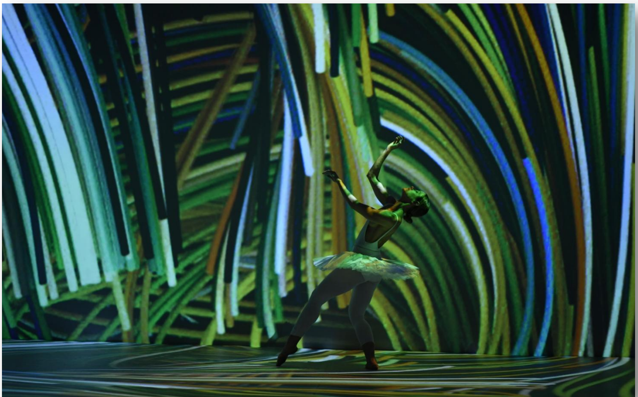
Sobre o Flamboyant Shopping Center

Presente em exposições, museus, livros, utensílios e todo tipo de objetos, a arte do pintor holandês inundou o imaginário popular, atravessou o tempo e ainda segue inspirando artistas com seu traço inconfundível.